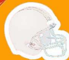
Casque + grille (obligatoire)