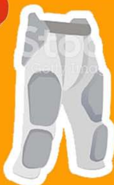
Protections hanches/ cuisses/genoux/coccyx (obligatoires)